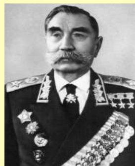
Буденный Семен Михайлович