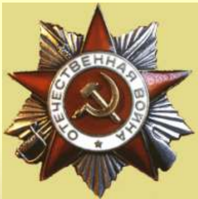
Орден Отечественной Войны 1-ой степени