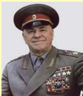
Жуков Георгий Константинович