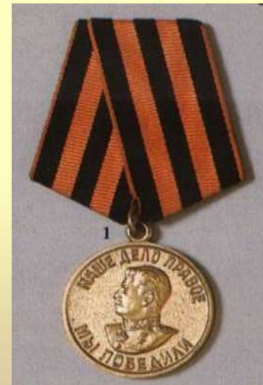
Медаль «За победу над Германией»