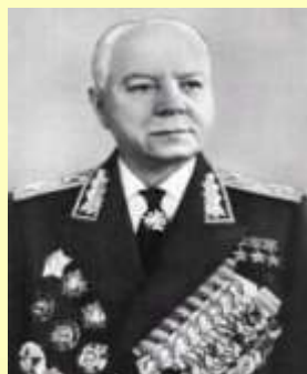
Ворошилов Климент Ефремович