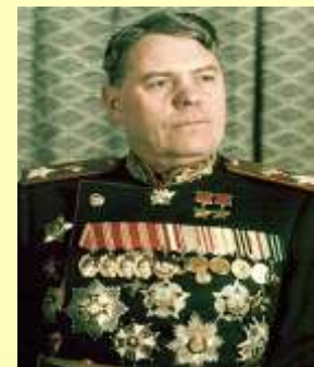
Василевский Александр Михайлович