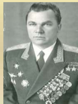
Кожедуб Иван Никитович