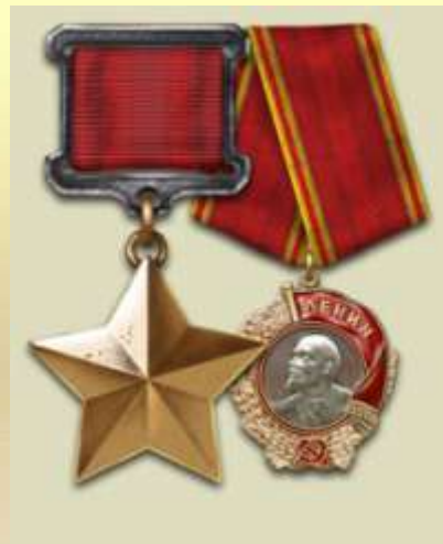
Золотая Звезда и Орден Ленина Героя Советского Союза