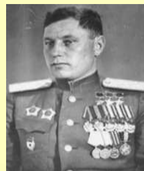
Покрышкин Александр Иванович