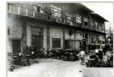
1955 год. Реутов. Механический завод.