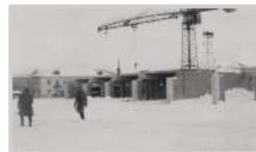
Строительство торгового центра на улице Комсомольской