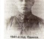
1941-й год. Одесса.

В конце ноября беседы прославленной фронтовой командой. Не надо, я думаю, переубеждать Великую Победу. И очень обидно, что мы так незаметно распорядились своей Победой. Так ли гордимся жить наш народ — народ-победитель?