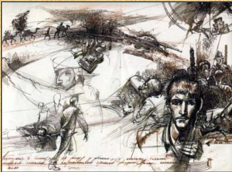
Рисунок о событиях в Афганистане из архива школы №4 города Реутова