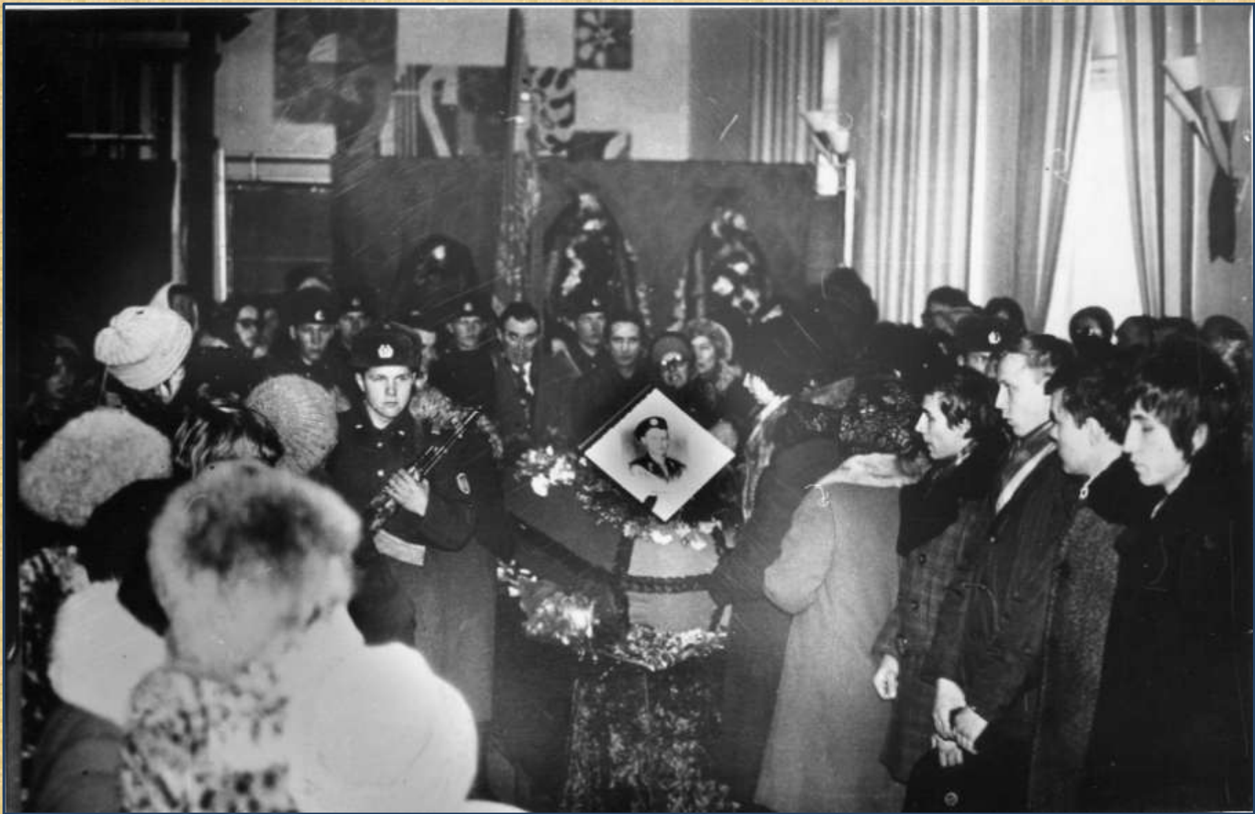
Прощание с Андреем Лысенко. 1981год.