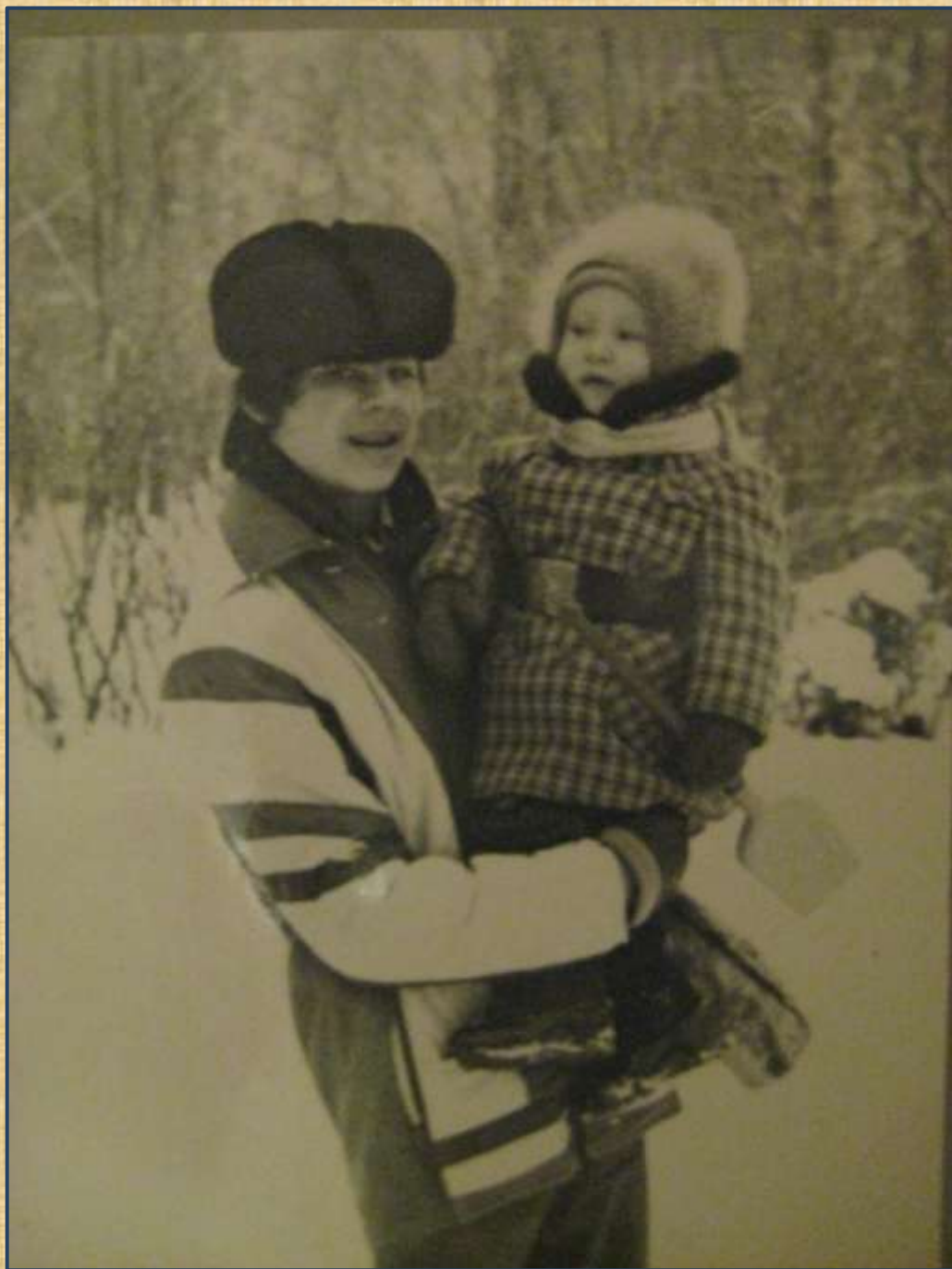
1979 год.