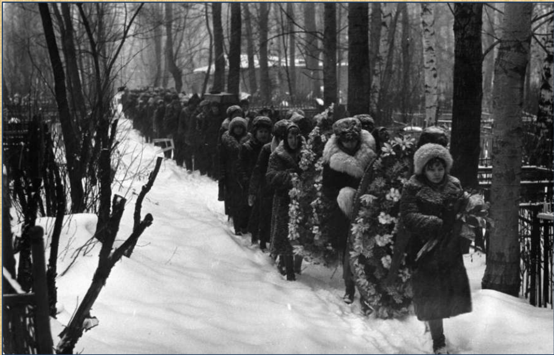
Похороны Андрея Лысенко. 1981год.