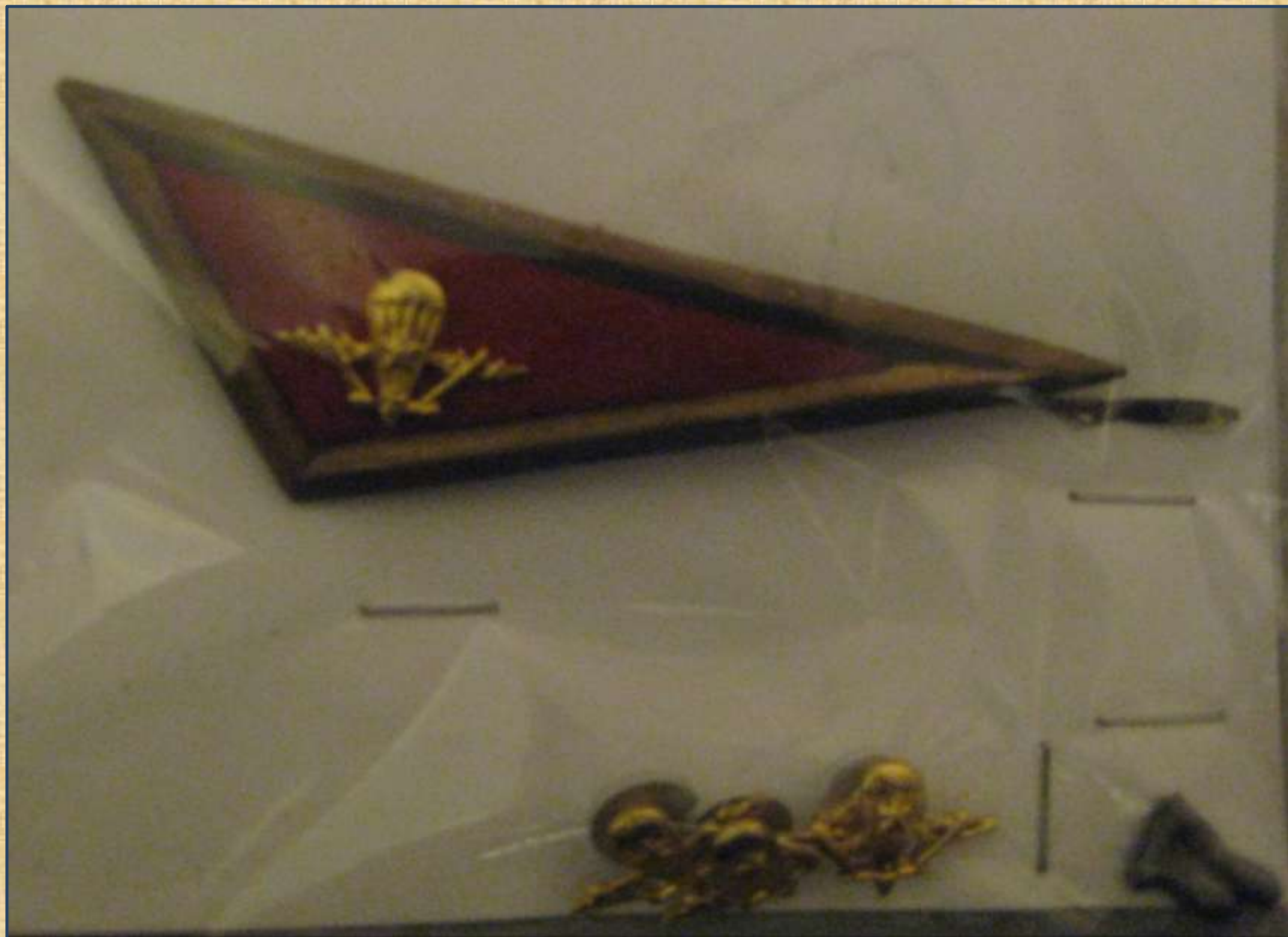
Реликвии из архива семьи Попковых.