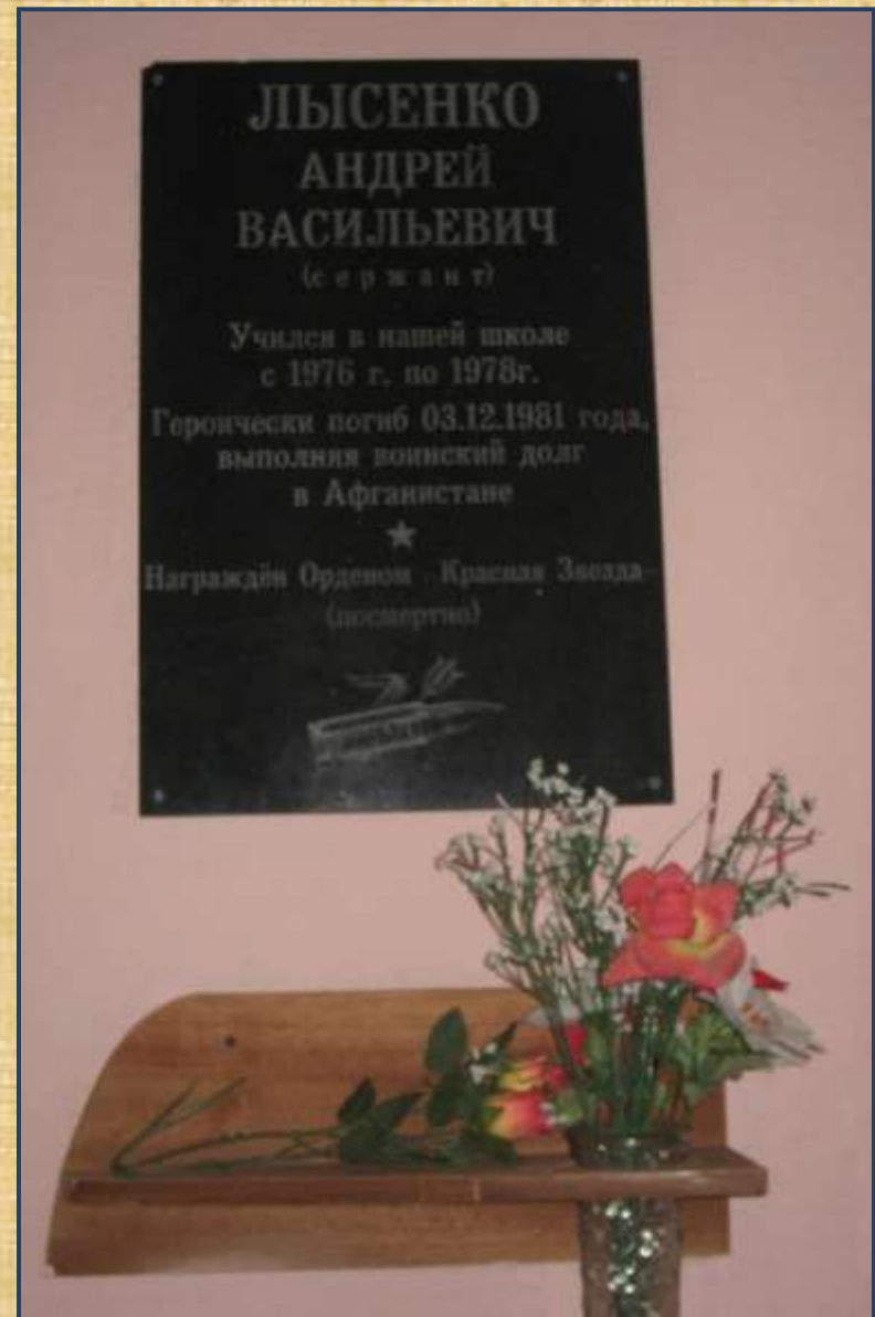
Мемориальная доска об Андрее Лысенко в школе №4 города Реутова.