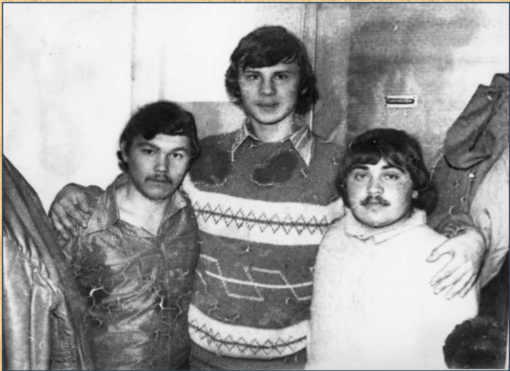
1979 год.