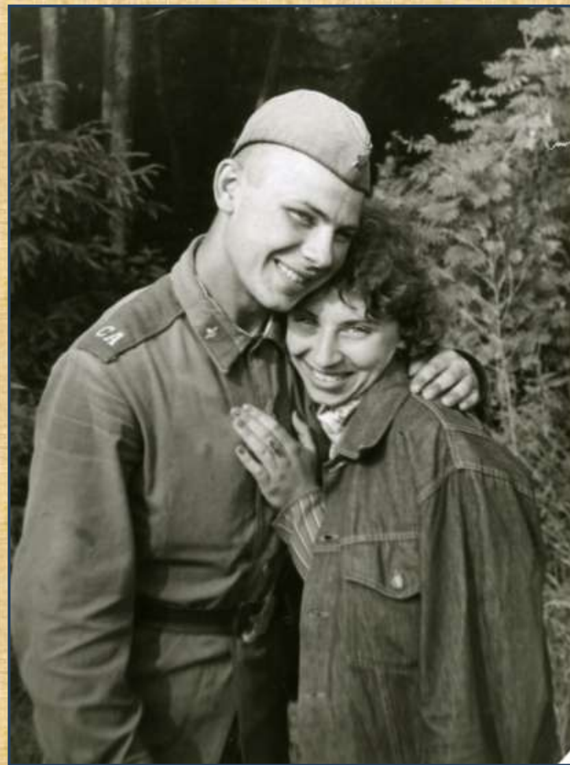
Фото из архива семьи Попковых. 1980 год.