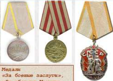
Медали «За боевые заслуги», «За оборону Москвы»